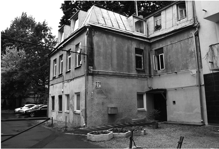
A. Mickevičiaus g. 27D.