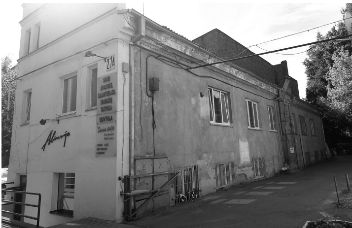
A. Mickevičiaus g. 27A.

bos statybų skyriaus komisija nustatė, kad sodybos teritorijoje esanti kalvė su mediniais sandėliais, kalvės reikmenimis ir butais kalvės darbininkams (kairiajame sklypo pakraštyje), medinis vieno aukšto pastatas dirbtuvėms (dešiniajame sklypo pakraštyje) ir prie gatvės stovintis medinis sandėlis yra visiškai apleisti ir kelia gaisro pavojų, todėl rekomenduojama kalvę iškelti į miesto pakraštį, o visa kita nustatyta esant netinkama