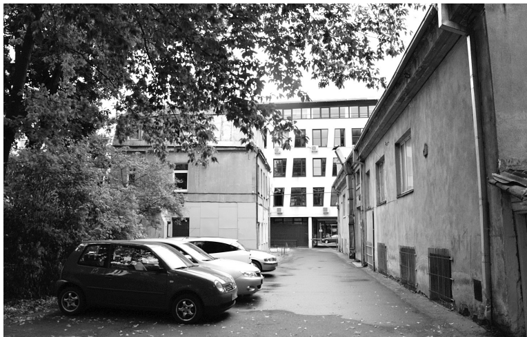
A. Mickevičiaus g. 27D (kairėje) ir 27A (dešinėje) iš kiemo pusės.

kurie leistų patvirtinti šią hipotezę, belieka tikėtis rasti ateityje.