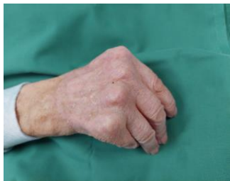
7 pav. Dešinės rankos plaštaka, pacienti atvykus kontrolinės konsultacijos po 3 mėn.