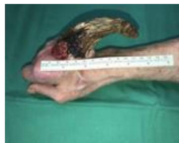
2 pav. Dešinės rankos plaštaka prieš operaciją (keratoakantoma ir odos ragas)