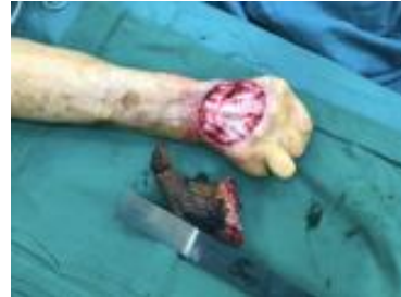
4 pav. Dešinės rankos plaštaka, pašalinus odos ragą ir keratoakantomą iki nepažeistų audinių