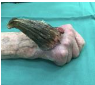
1 pav. Dešinės rankos plaštaka prieš operaciją (keratoakantoma ir odos ragas)

Išvada – darinys pašalintas radikaliai. Pooperacinis periodas sklandus, žaizda švari, nešlapiuoja. Pacientei atvykus kontrolinės konsultacijos po operacijos, matyti prigijusi oda, pastebimas nežymus randas (7 pav.).