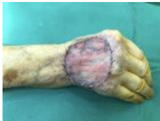
5 pav. Dešinės rankos plaštaka, pašalinus odos ragą ir keratoakantomą iki nepažeistų audinių