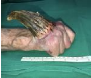
3 pav. Dešinės rankos plaštaka prieš operaciją (keratoakantoma ir odos ragas)