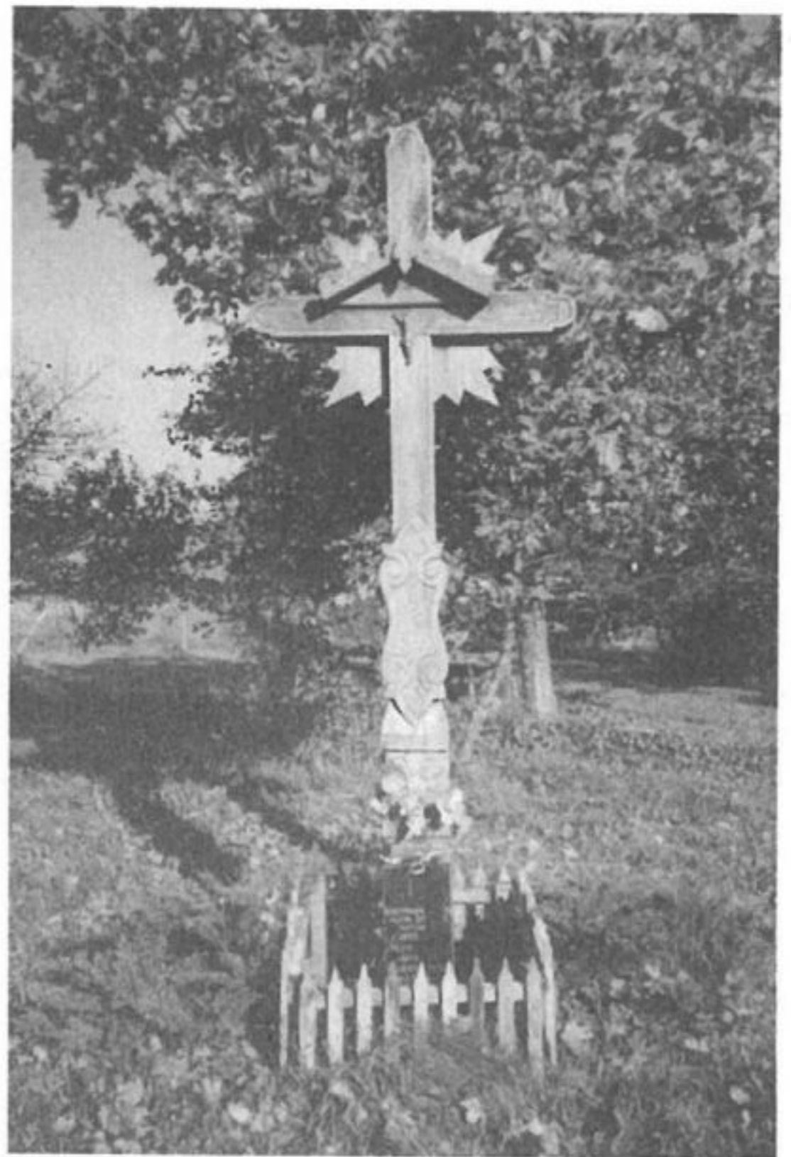
Kryžius paskutiniųjų Šilalės krašto partizanų atminimui Buišių kaime