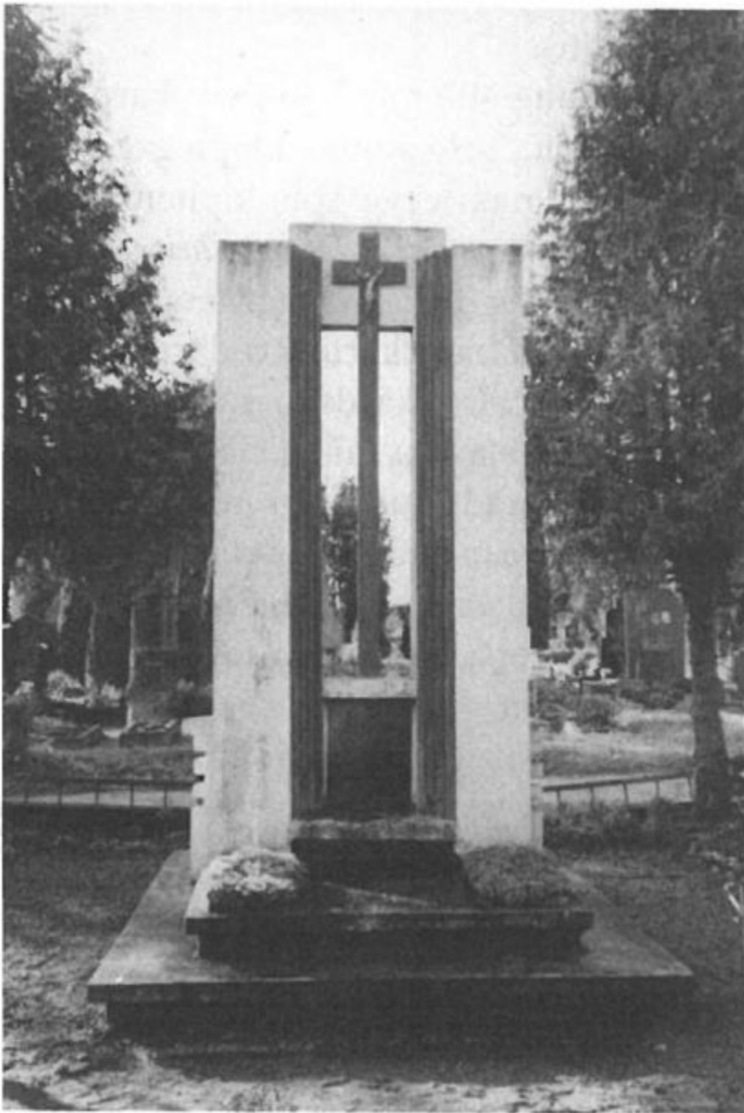
1941 m. sovietų kariuomenės nužudytų žmonių kapas Kvėdarnos kapinėse