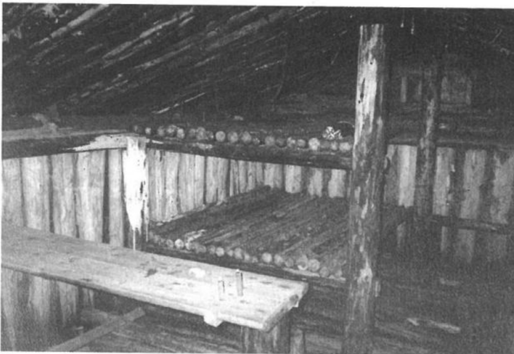
Lukšto būrio žeminės vidus

Lukšto būrio slėptuvė iš kitų pastaruoju metu atstatytų partizanų žeminių išsiskiria autentiškumu. Pradėjus darbus buvo aptiktos jos senosios grindys, sienų likučiai (taigi buvo galima tiksliai nustatyti dydį), o kaip atrodė visa kita, papasakojo mūsų die-