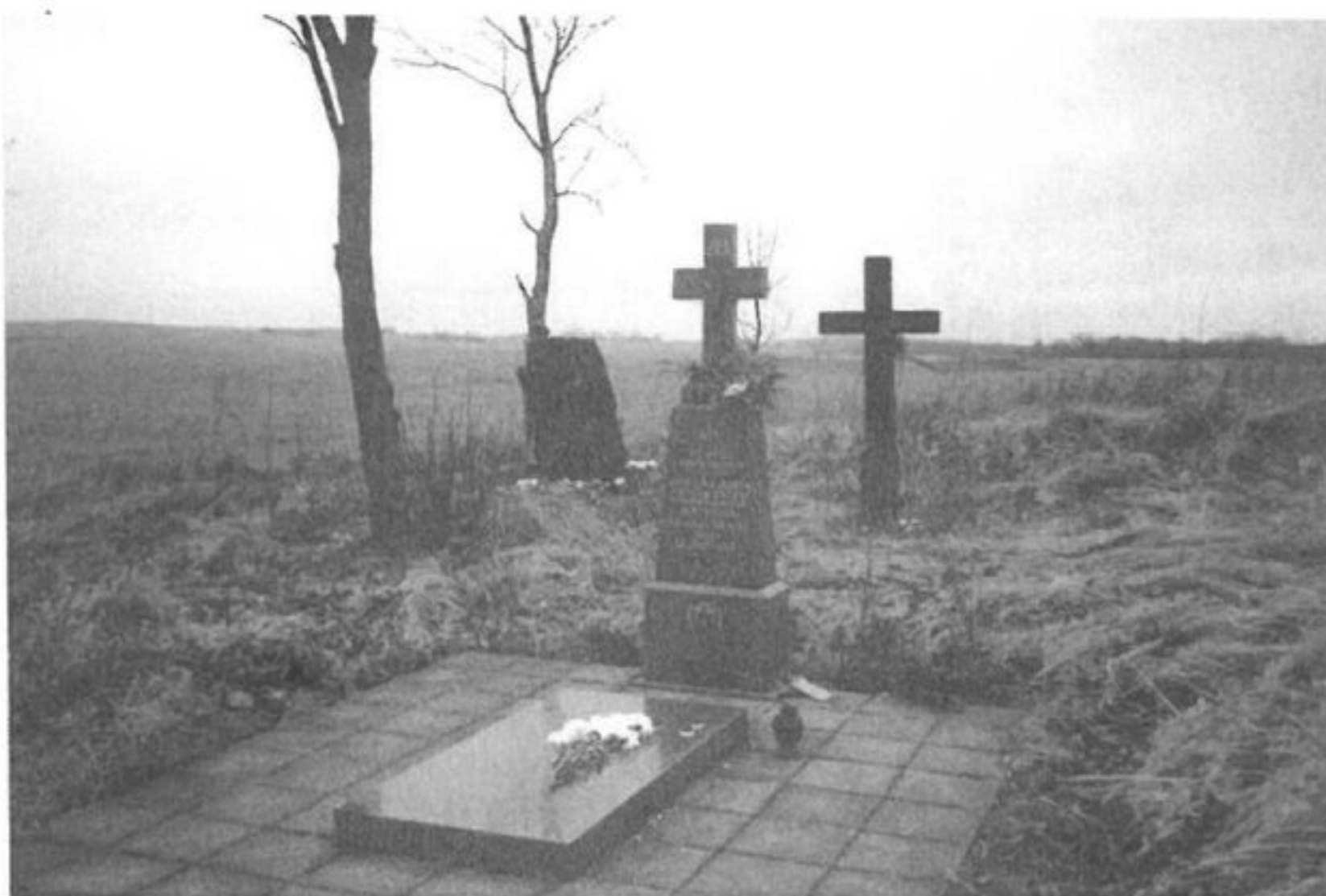
1941 m. nužudytų žmonių kapas Dargalių kapinėse

Dargaliai. Kaimas yra šeši kilometrai į pietus nuo Laukuvos. Dargalių žemes beveik perpus skiria naujasis Žemaičių plentas. Vos keliasdešimt metrų į šiaurę nuo jo išlikusios senos kapinaitės (26). Be kelių medinių kryžių, čia stovi akmeninis paminklas su iškalbingu užrašu: „Bolševikų genocido aukos 1941.VI.24“. Data primena karo pradžią ir pirmosiomis jo dienomis sovietų kariuomenės įvykdytas žudynes Kvėdarnos apylinkėse (žr. atitinkamą skyrelį), Panevėžyje, Pravieniškėse, Rainiuose. Siautėta ir čia, Dar-