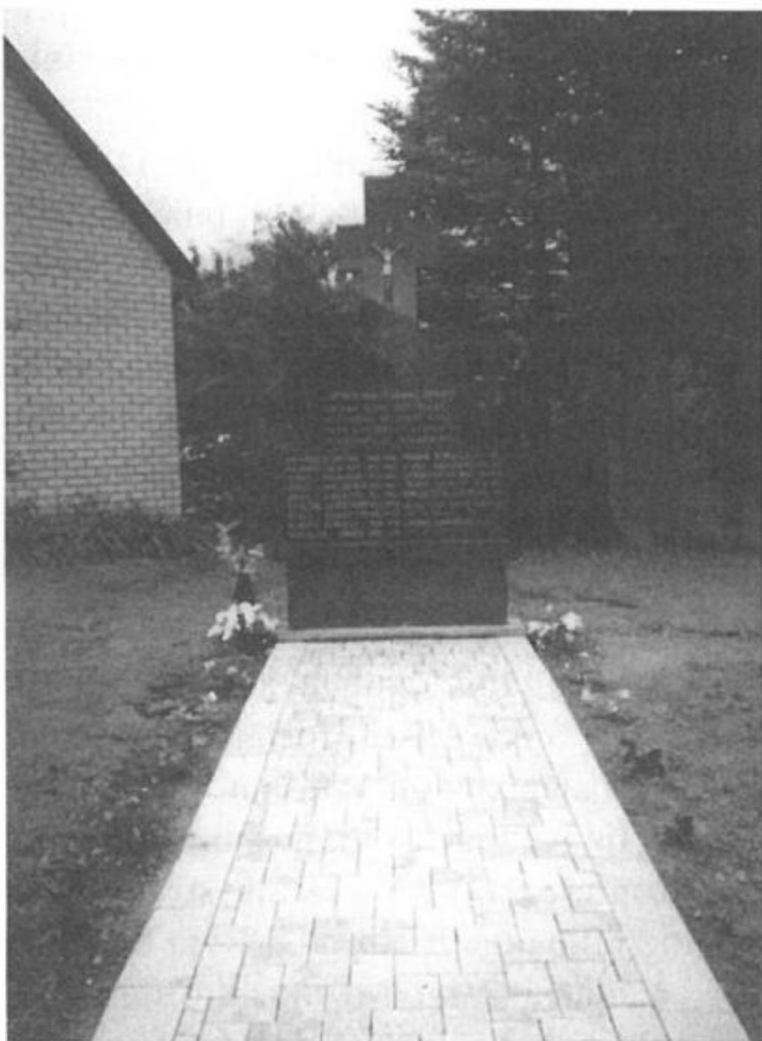
Paminklas Upynos partizanams

Miestelio kapinių centre, priešais koplyčią, kitapus tako yra rusvo granito antkapis su užrašu „A. a. Barbora Sugintienė“. Tai