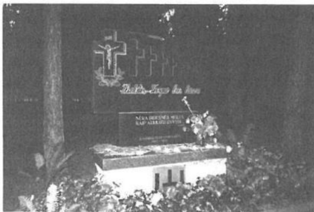
Paminklas masinėje partizanų užkasimo vietoje prie Šilalės evangelikų liuteronų kapinių

Šiaurės rytiniame miesto pakraštyje, evangelikų liuteronų kapinių pašonėje yra masinė partizanų užkasimo vieta (3). Vyksiant rezistencinėms kovoms Šilalės sribai ir enkavėdistai būtent čia užkasė daugumą Šilalės apylinkėse žuvusių ir šiame mieste niekintų partizanų bei jų rėmėjų kūnų. Bendras palaidotųjų skaičius nėra žinomas, bet jų turėtų būti ne mažiau kaip keliasdešimt. Jau nuo seno užkasimo vietose supilta apie