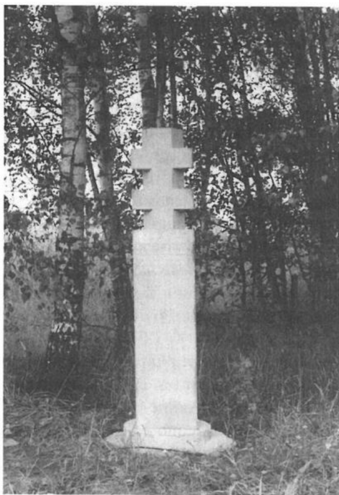
Tipinis atminimo ženklas Lentinės kaime žuvusiems partizanams

reikia vykti Šilalės–Pajūrio plentu. Apie pusantro kilometro nuo miesto ribos, ties pirmą sodybą dešinėje kelio pusėje sukti į kairę ir nukakti dar 100 metrų.